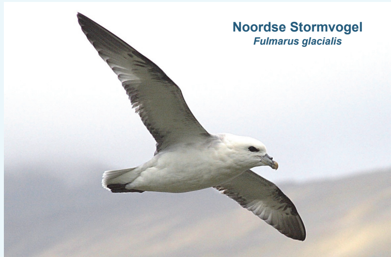
Noordse Stormvogel Fulmarus glacialis

Verandering vereist bewustwording en gerichte aandacht voor belangrijke bronnen van afval in de Noordzee zoals scheepvaart en visserij.